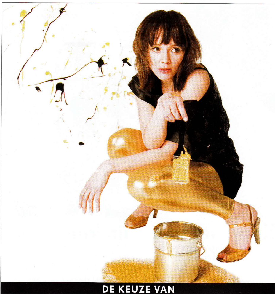
DE KEUZE VAN

Italiaanse Combattimento Consort Op zaterdag 19 t/m 22 mei. De Italiaanse componist Antonio Salieri won ooit een wedstrijd van Mozart met zijn komische opera Prima la musica, poi le Parole . Geef uw eigen bijdrage tijdens een optreden van Het Combattimento Consort Amsterdam in Muziekgebouw aan 't IJ.